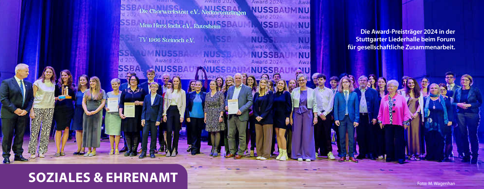
Die Award-Preisträger 2024 in der Stuttgarter Liederhalle beim Forum für gesellschaftliche Zusammenarbeit.