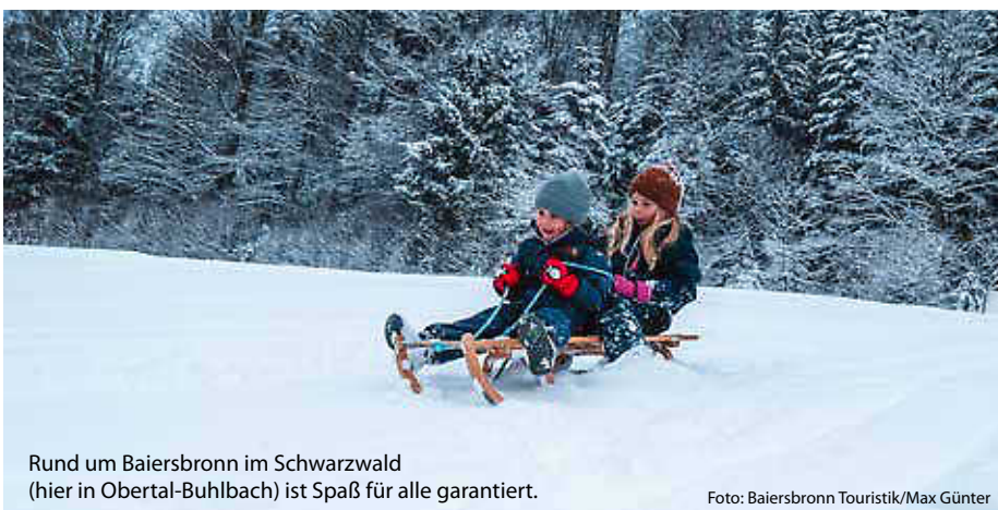
Rund um Baiersbronn im Schwarzwald (hier in Obertal-Buhlbach) ist Spaß für alle garantiert.

... gibt es die Hänge am Feldberg, Kandel oder rund um Todtnau. Hier wird es steil, schnell und aufregend. Größere Kinder werden diese Hänge lieben – vorausgesetzt, Eltern haben starke Nerven und den Kids gute Bremstechnik beigebracht. (jr/red)