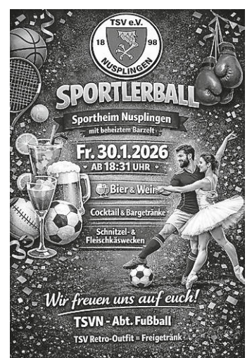
TSV Sportlerball Plakat: TSV

Wir freuen uns auf euch und die geile Party mit euch!