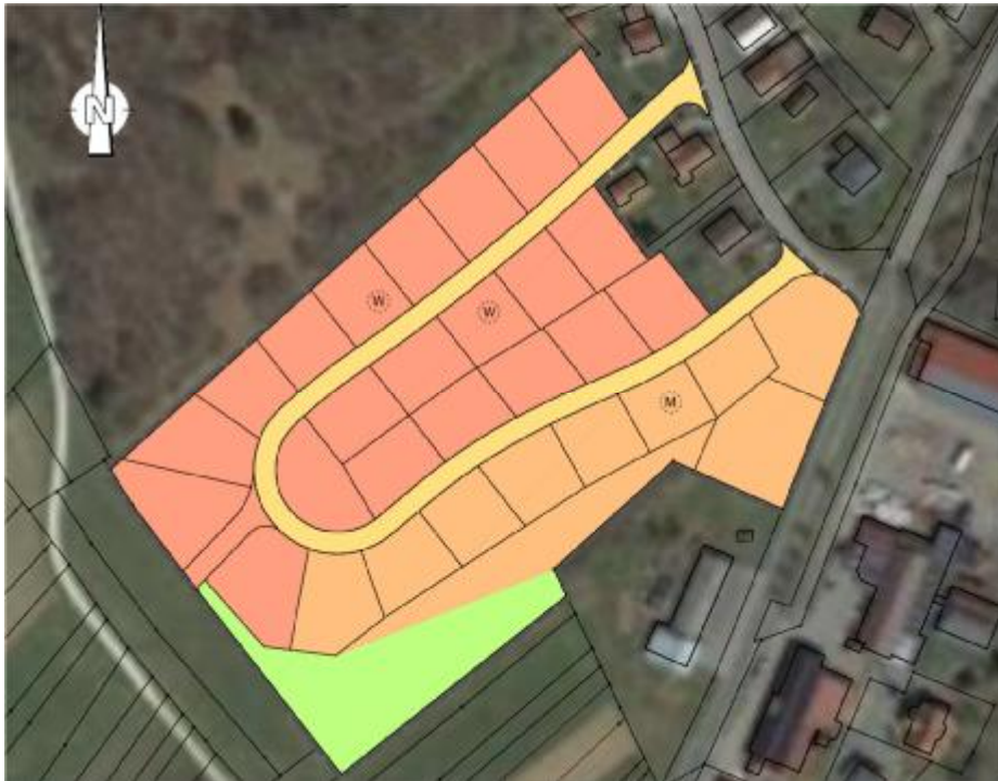
Abbildung 1: Ausschnitt aus dem rechtswirksamen FNP (siehe auch Anlage 1.1 <11_UebersichtPlanung_FNP_nu02640a_09_dwg.pdf>)