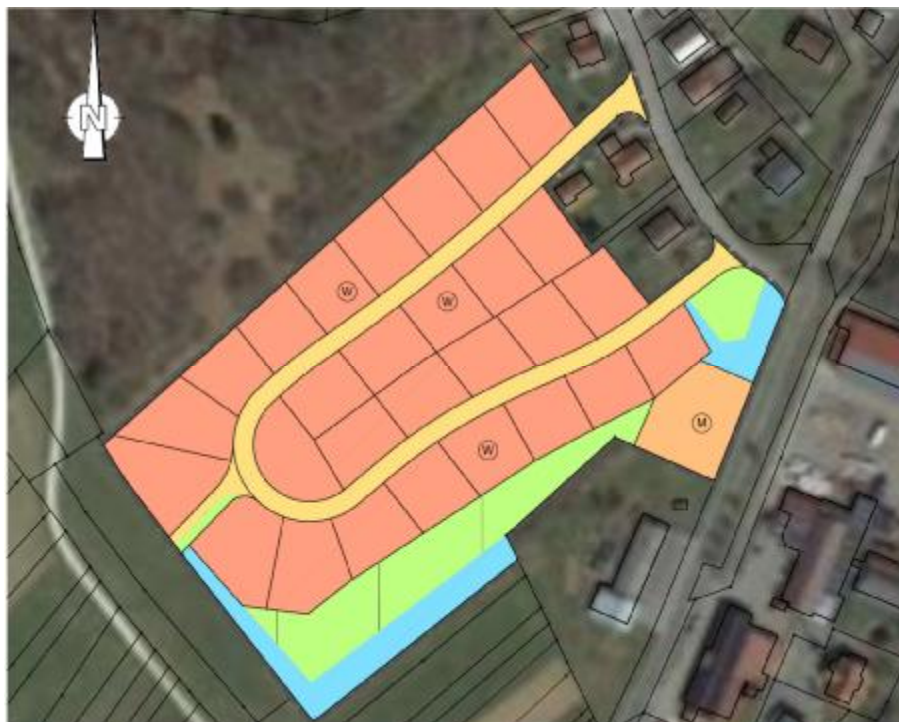
Abbildung 2: 1. Berichtigung des FNP im Bereich des Bebauungsplanes "Hirtenwiese II - 1. Änderung (siehe auch Anlage 1.2 <12_UebersichtBestand_FNP_nu02640a_10_dwg.pdf>)